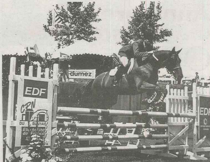
C'est en 1982 que le Jumping s'installe dans la Citadelle de Blaye